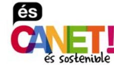
% recollida selectiva Canet de Mar